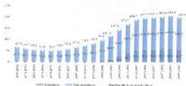
Kai kurios aukštosios mokyklos reikalauja, kad praktikos BENDRO (visų pakopų) studentų skaičiaus kitimas Lietuvos aukštesiosiose mokyklose 1990 – 2009 m. (tūkst.)

Studentų praktikos organizavimo metu reikšmingas yra praktikos užduoties formulavimo etapas, kadangi nuo to, kaip suformuluota praktikos užduotis, tiesiogiai priklauso praktikos kokybė bei galutinis studento praktinio pasirengimo rezultatas. Todėl, siekiant studentų praktikos efektyvumo ir kryptingo praktinių įgūdžių ugdymo, praktikos užduoties formulavimo etape aukštosios mokykloms tikslinga bendradarbiauti su draudimo ir finansų sektoriaus įmonėmis. Praktika rodo, kad dažnai praktikos užduotis skiria aukštosios mokyklos praktikos vadovas, atitinkamos katedros vedėjas ir pan., neatsižvelgdami į darbdavio lūkesčius, ir tik maža dalis aukštųjų mokyklų užduotis skiria suderinę jas su įmone, kurioje bus atliekama praktika. Trišalėje praktikos sutartyje nėra numatyta jokių apribojimų, jog įmonės, kurioje atliekama praktika, praktikos vadovas negalėtų studentui skirti ir savo užduočių, tačiau paprastai jie to nedaro. Viena iš tokių darbdavių pasyvumo priežasčių – darbdavių motyvacijos stoka aktyviau dalyvauti profesinio rengimo sistemoje. Kitos svarbios priežastys – laikas, kompetencijos bei išlaidų stoka.